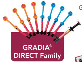
GRADIA® DIRECT Family

G2-BOND Universal, der neue Standard der 2-Flaschen Universal-Bondings, mit all unseren GC Produkten.