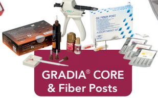
GRADIA® CORE & Fiber Posts