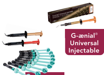
G-ænial® Universal Injectable

Unsere starken und kompetenten Adhäsivsysteme für all Ihre täglichen restaurativen Aufgabestellungen