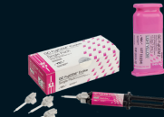
FujiCEM® 2 SL FujiCEM™ Evolve