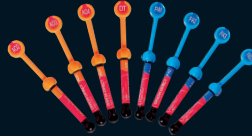
GRADIA® DIRECT Family