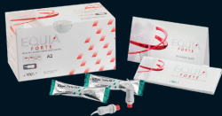
EQUIA Forte™ HT