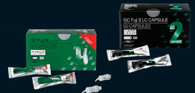
GC Fuji® IX GP FAST GC Fuji® II LC